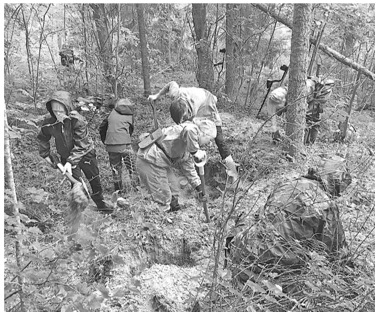
Работа поисковиков в лесу

Ближайшая вахта состоится в августе в д. Давыдово Старорусского района, где уже с 2016 года ведётся поиск погибших солдат. Несколько раз командир планировал сменить локацию, но «место не отпускает» и каждую вахту «отдаёт» именным солдат, с медальонами.